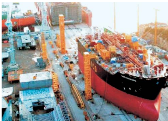
Slika 4 Premještanje dijela broda na baržu pomoću hidrauličkoga transportera

Neka od velikih svjetskih brodogradilišta koriste barže na kojima se montiraju dijelovi broda. Blokovi i moduli brodskoga trupa s potpuno ugrađenom opremom sagrađeni na ravnoj površini dopreme se pomoću hidrauličkoga transportera na baržu gdje se spajaju, slika 4. Brod se pomoću barže predaje vodi. Ova tehnologija znatno skraćuje vrijeme gradnje.