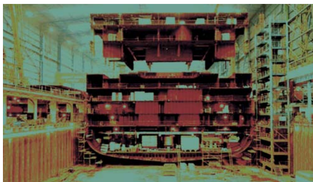
Figure 5 Hull blocks assembly in Meyer Werft Papenburg