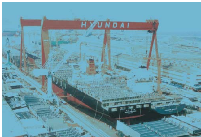
Slika 2 Megadok s goliat dizalicama u brodogradilištu Hyundai HI Ulsan [3]

Figure 2 Megadock with goliath cranes in Hyundai HI Ulsan shipyard