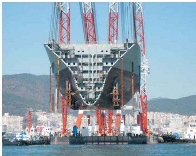
Slika 3 Plovna dizalica brodogradilišta Samsung podiže megablok

Pored velikih megadokova, brodogradilište Samsung Geogje gradi brodove i u dva velika plovna doka dimenzija 450x55 metara i kapaciteta 400 000 dwt. Njih poslužuju dvije velike plovne dizalice nosivosti 3500 i 3000 tona, 96 metara visine dizanja iznad vodne linije i kraka dizanja od 47 metara, slika 3. Pomoću ovih dizalica afamax tanker je moguće u plovnom doku sastaviti u samo deset modula.