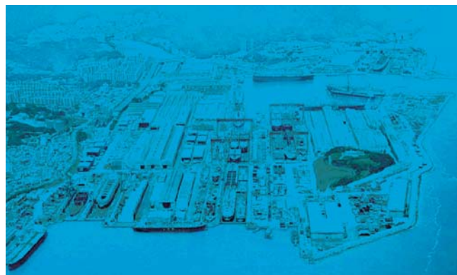
Slika 1 Panorama brodogradilišta Hyundai HI Ulsan [1] Figure 1 The panoramic view of Hyundai HI Ulsan shipyard