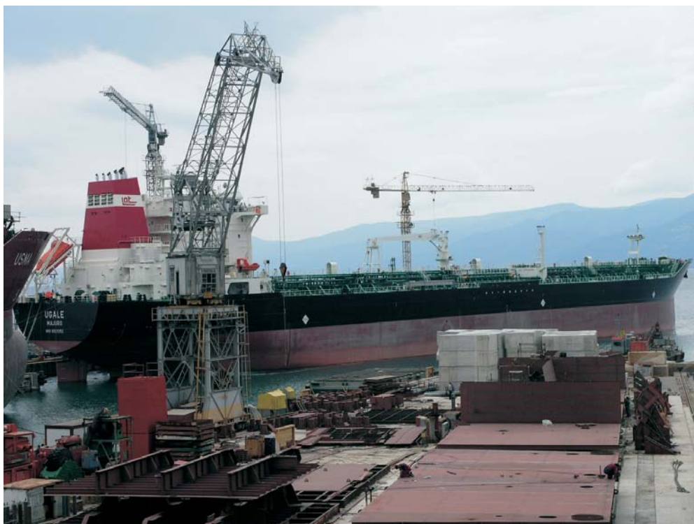
Ugale – druga ovogodišnja isporuka za Latvian Shipping Company

Do kraja 2007. godine, 3. maj Brodogradilište d.d. planira isporučiti još tri identična tankera iz 'latvijskog programa'.